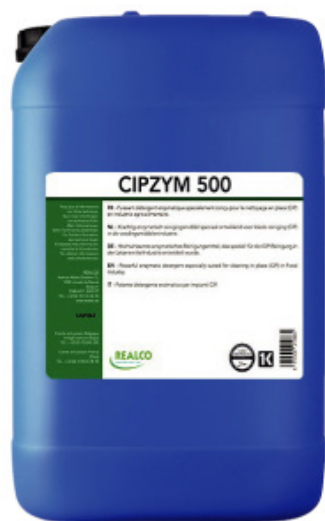
Detergente multi enzimatico concentrato per CIP