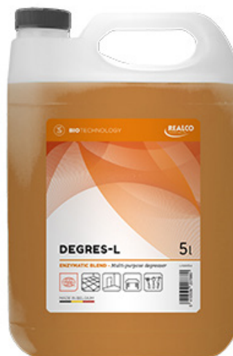
Detergente liquido a base di enzimi per impiego manuale, CERTIFICATO ecocert