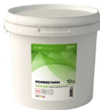
Potente detergente multi enzimatico in polvere, CERTIFICATO ecocert