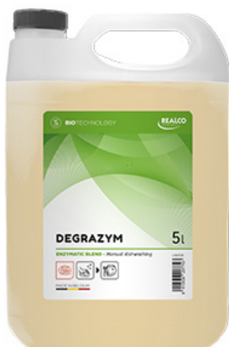
Sgrassante enzimatico multiuso CERTIFICATO ecocert